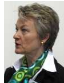
Sehr geehrte Kunden,

Bitte melden Sie sich unter info@dill-online.de bis spätestens zum 17.06.2011 an.